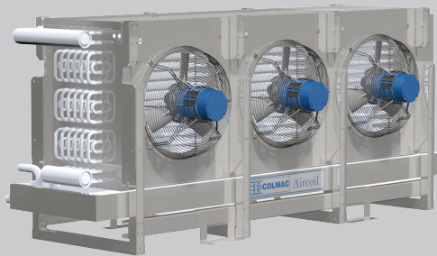
Evaporadores Aircoil para Aplicaciones Industriales y Cuartos de Procesos