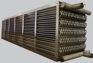
Enfriadores Baudelot para Enfriamiento de Líquidos cerca del punto de Congelación