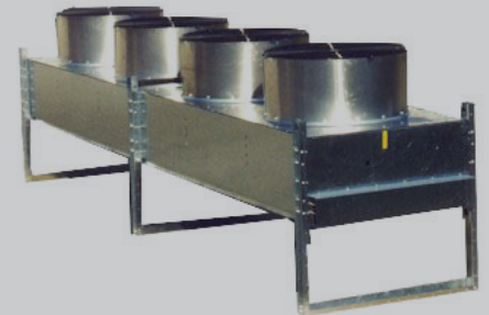
Condensadores Enfriados por Aire para Amoníaco, Halocarbonos e Hidrocarbonos

AHRI-410, UL508, ASME Sec. VIII, Canadian Registration Number, Canadian Standards Association