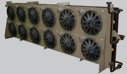
Enfriadores de Circuito Cerrado para Glicol o Enfriamiento de Gases