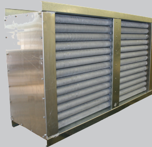
Tubos de Calor para Recuperación de Calor